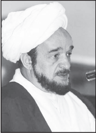
علی عالی اعلا که ز بیم نهلش روح از کالبد عالم امکان خیزد