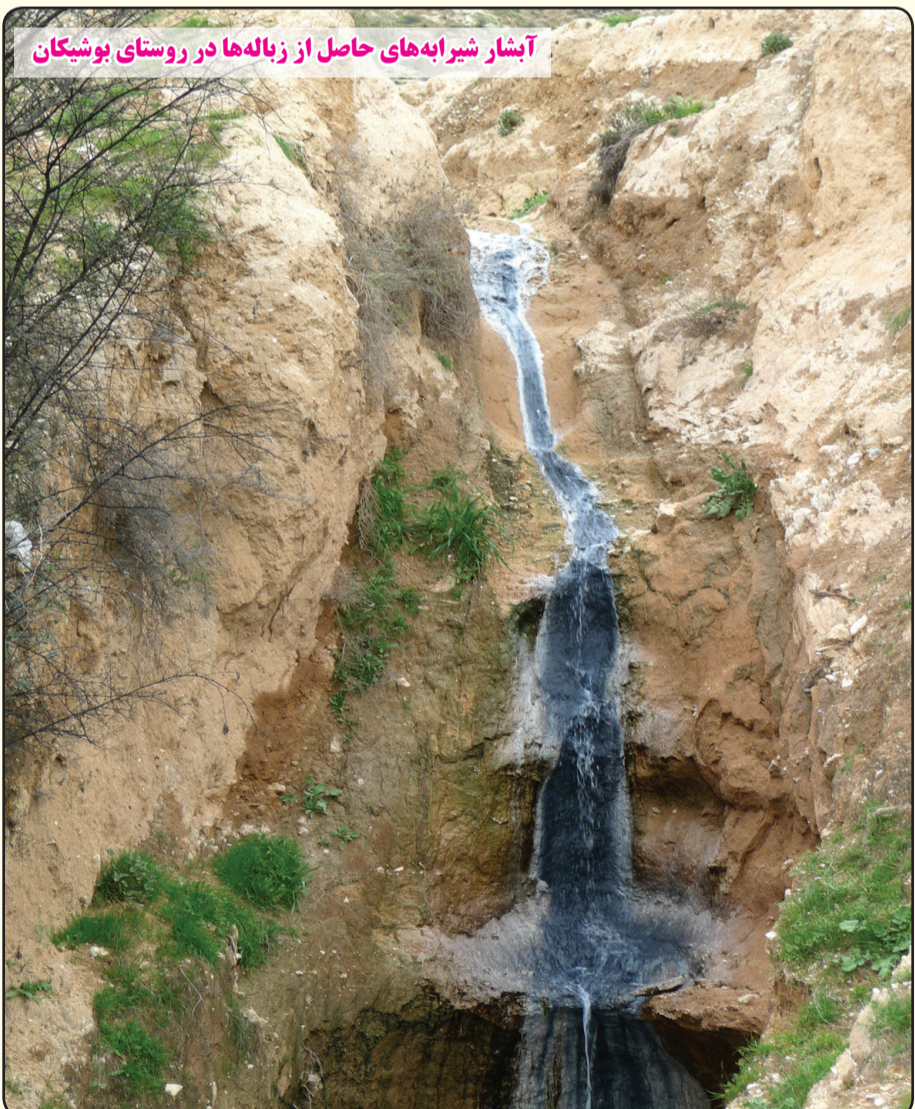
آبشار شیرابه‌های حاصل از زباله‌ها در روستای بوشیکان