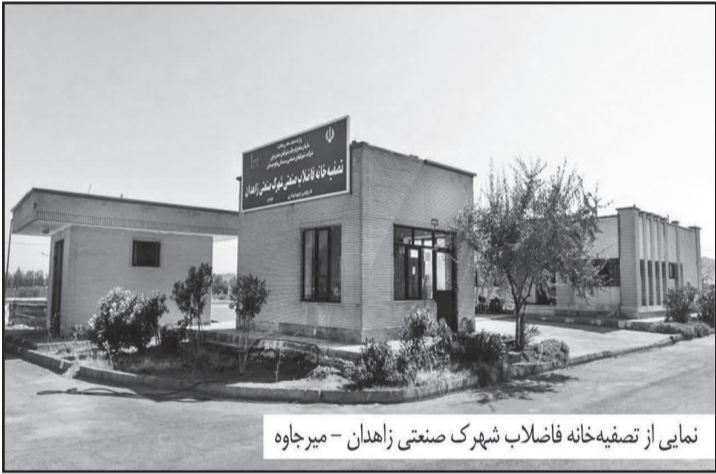
نمای از تصفیه‌خانه فاضلاب شهرک صنعتی زاهدان – میرچاوه