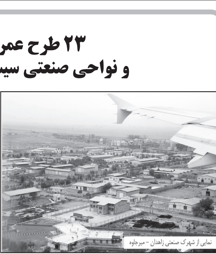
نمای از شهرک صنعتی زاهدان – میرچاوه