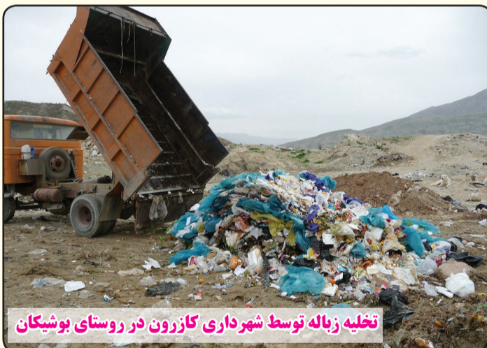
تخلیه زباله توسط شهرداری کازرون در روستای بوشیکان