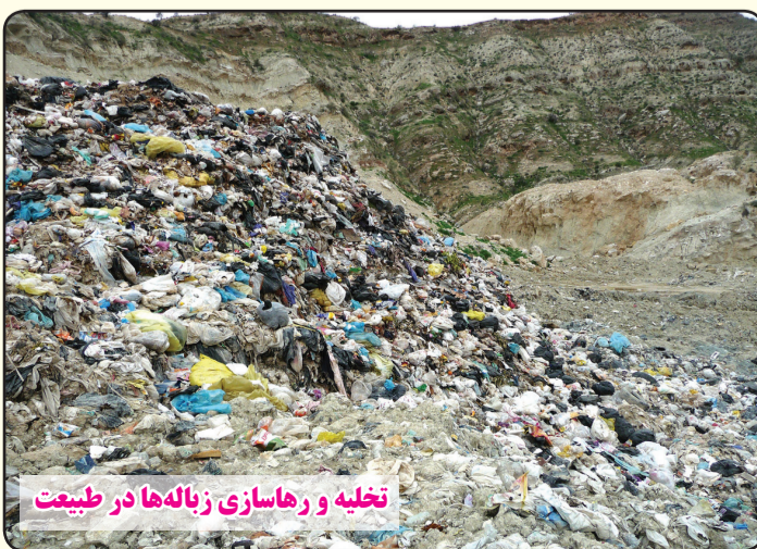
تخلیه و رها سازی زباله‌ها در طبیعت