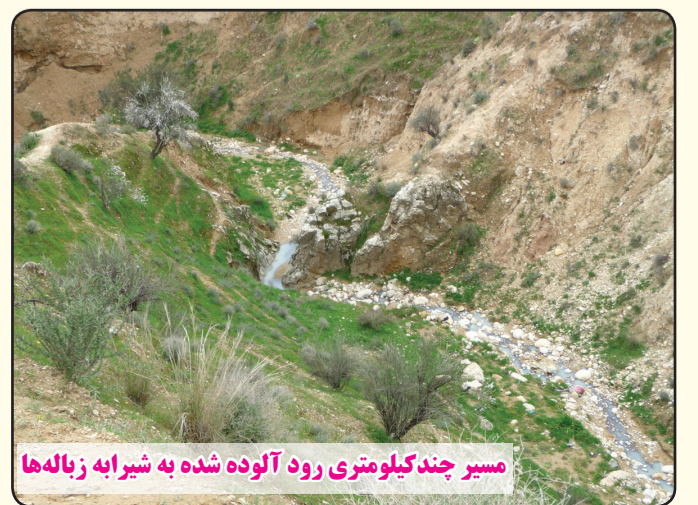
مسیر چند کیلومتری رود آلوده شده به شیرابه زباله‌ها