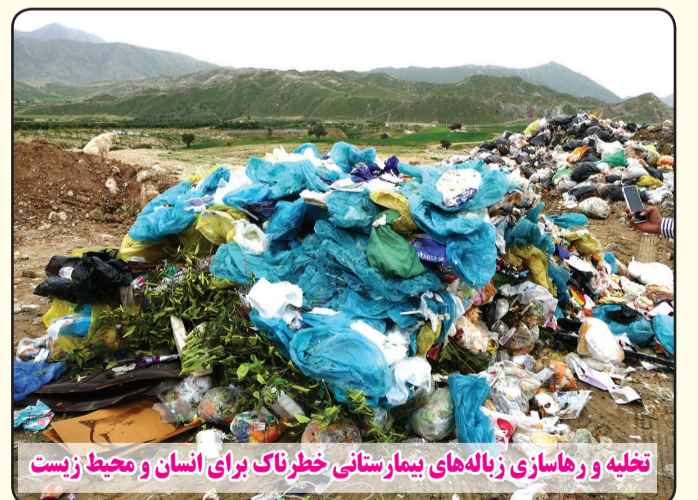
تخلیه و رها سازی زباله‌های بیمارستانی خطرناک برای انسان و محیط زیست