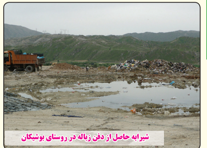
شیرابه حاصل از دفن زباله در روستای بوشیکان