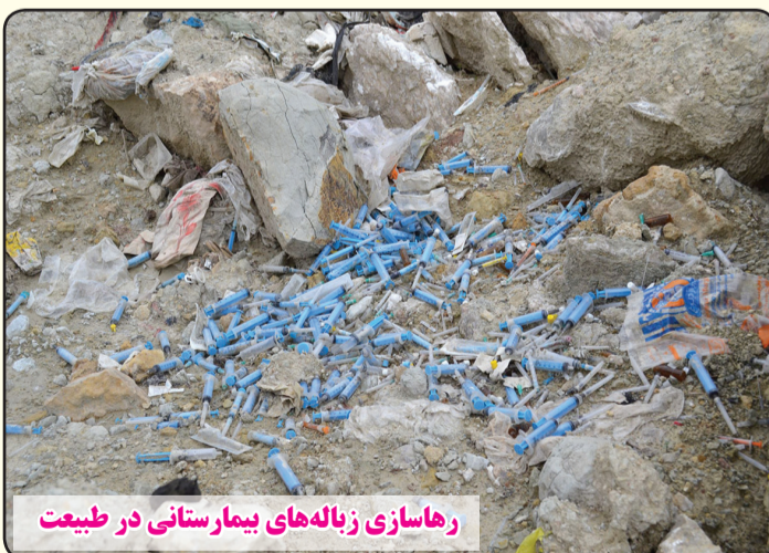
رها سازی زباله‌های بیمارستانی در طبیعت