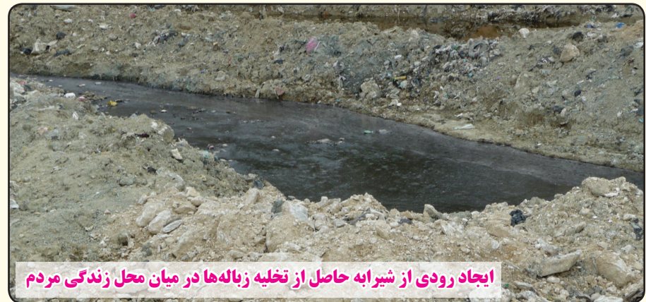
ایجاد رودی از شیرابه حاصل از تخلیه زباله‌ها در میان محل زندگی مردم