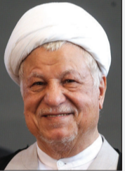
آیت‌الله هاشمی رفسنجانی

۲– لطفاً خاطره‌ای از نوع حکمرانی آیت‌الله هاشمی رفسنجانی بفرمایید.