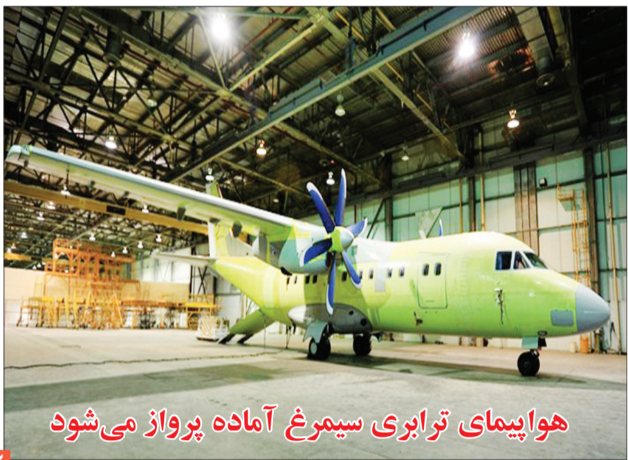
هواپیمای ترابری سیمرغ آماده پرواز می شود

اوکراین: تلفات روسیه در جنگ تا کریسمس به ۱۰۰ هزار کشته می رسد