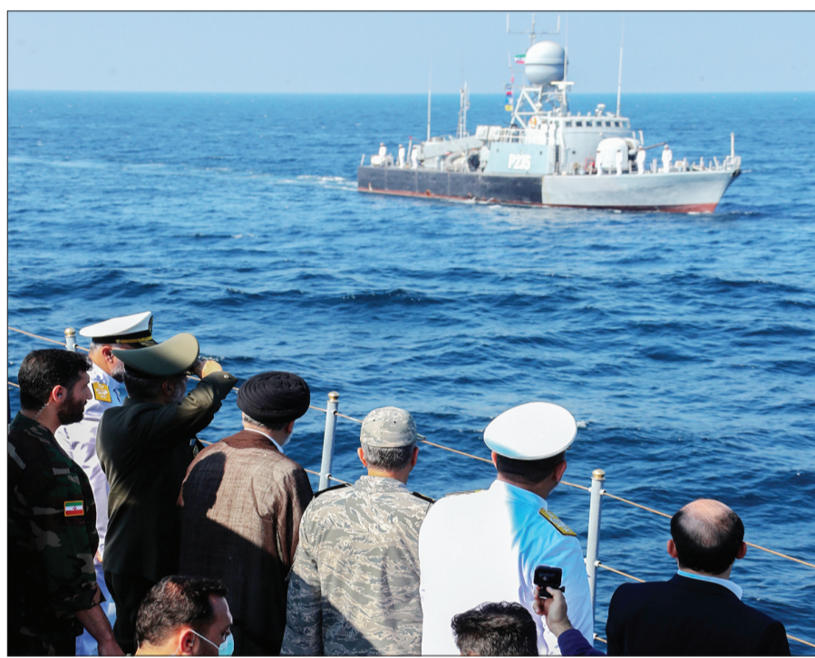
رژه یگان‌های نمونه نیروی دریایی ارتش با حضور رئیس جمهور

یک روز پس از «دستور ویژه» اژه‌ای برای آزادی برخی زندانیان «قضایای اخیر» ۴۶ زندانی در تهران و ۱۴ زندانی در هرمزگان که شرایط ارفاق قانونی را داشتند، آزاد شده و به آغوش گرم خانواده بازگشتند دستور ویژه رئیس دستگاه قضا به مراجع ذیربط قضایی برای بهره مندی زندانیان از ارفاقات قانونی و بازگشت آنان به آغوش گرم خانواده با واکنش‌های مثبتی روبه رو شد