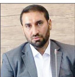
از برنامه‌های راهبردی مدیریت درمان

۲۰درصد خمیرمایه همگن کشور و ۵۰درصد خمیرمایه همگن مورد نیاز استان خراسان رضوی را تأمین می‌کرد که با توجه به کیفیت بالای خمیرمایه تولیدی، تعداد زیادی از بازارهای جدید داخلی و خارجی، متقاضی دریافت این محصول بودند و با اجرای طرح توسعه و افزایش ظرفیت تولید، بخشی از این تقاضاها تأمین خواهد شد. با بهره‌برداری از این طرح، علاوه بر افزایش ظرفیت تولید، قیمت تمام شده محصول تولیدی نیز کاهش می‌یابد و قدرت ورود به بازارهای هدف داخلی و خارجی افزایش خواهد یافت.