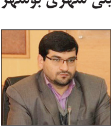
بوشهر – خبرنگار