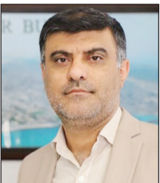
بوشهر – خبرنگار

روزنامه جمهوری اسلامی: مدیرعامل شرکت آب و فاضلاب استان بوشهر گفت: اجرای طرح مدیریت مصرف با هدف گسترش فرهنگ صرفه جویی و پرورش بهینه آب در مدارس این استان آغاز شده است.