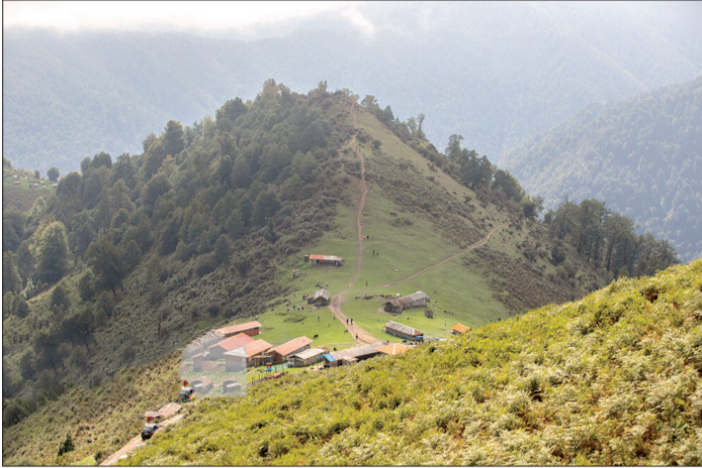
یک روستای توریستی در استان گیلان