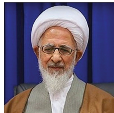
حضرت آیت‌الله جوادی آملی: امروز «تازیانه فقر» پشت مردم را زخم کرده است؛ مسئولان تدبیر کنند