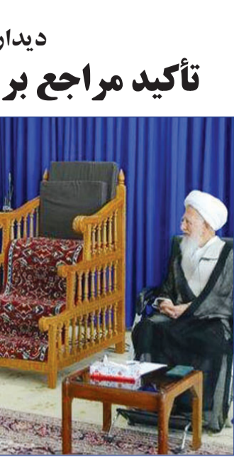
سردار اشتری در دیدار با مقامات وزارت کشور

بخش خبری: سردار اشتری فرمانده کل نیروی انتظامی کشور، پیش از ظهر پنجشنبه با چند تن از مراجع تقلید قم دیدار و گفتگو کرد. در این دیدارها مراجع عظام تقلید ضمن تأکید بر سامان‌دادن مشکلات اقتصادی و گرانی توسط دولت از خدمات نیروی انتظامی در برقراری امنیت و ایجاد نظم در جامعه تجلیل کردند. حضرت آیت‌الله جوادی آملی در دیدار سردار اشتری فرمانده فراجا از زحمات خالصانه نیروی انتظامی قدرانی و برای شهدای این نیرو علوّ درجه منسلت کرد.