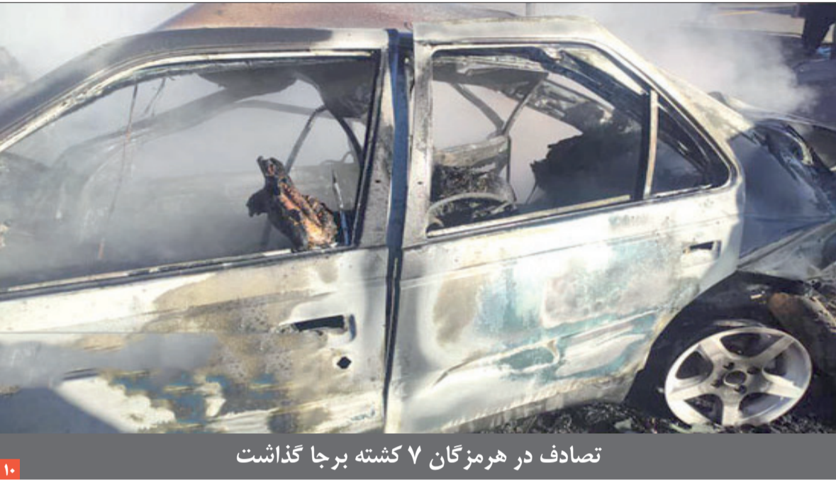
تصادف در هرمزگان ۷ کشته برجا گذاشت

رحمت‌الله نوروزی نماینده علی‌آباد کتول: تا کی می‌خواهیم ارابه‌های نقش کش داشته باشیم؟ واردات خودرو را آزاد کنید