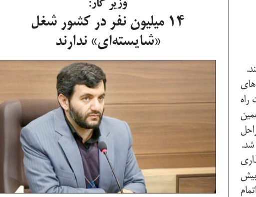
پنجشنبه ۱۸ فروردین ۱۴۰۱ - شماره ۱۳۳۰ - سال چهل و سوم

به گفته حجت‌الله عبدالملکی، وزیر تعاون، کار و رفاه اجتماعی در کشور ۱۴ میلیون تن از شغل شایسته‌ای برخوردار نیستند، حدود ۶ تا ۷ میلیون شغل غیر رسمی و ۲ میلیون اشتغال ناقص وجود دارد، همچنین افرادی نیز وجود دارند که از درآمد مکفی برخوردار نیستند.