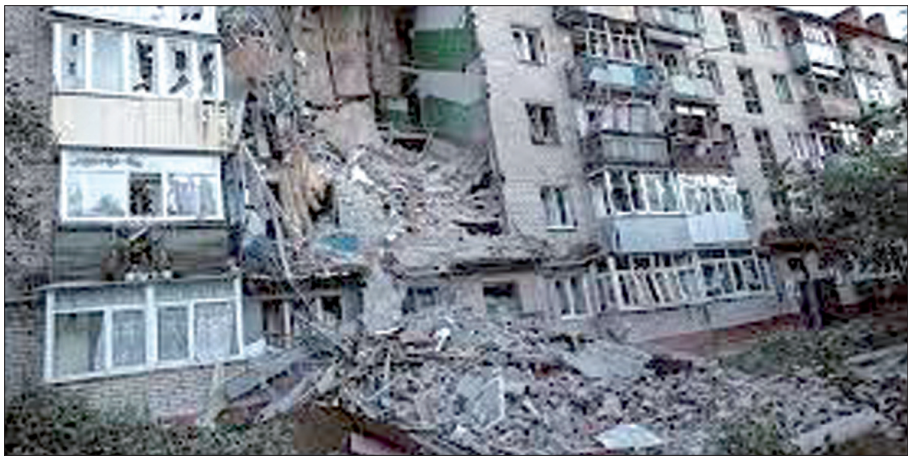
پای میز مذاکره بنشینیم.

به گزارش ایسنا، «ولودیمیر زلنسکی» رئیس جمهوری اوکراین در این مصاحبه مشترک از یک ساختمان در مکانی نامشخص در کی‌یف گفت: شما اول از همه باید صحبت کنید. همه باید درگیری را متوقف کنند و به تقه‌لای که پنج شش روز پیش از آنجا درگیری‌ها آغاز شد، برگردند. توقف بمباران مردم مهم است و ما بعد از آن می‌توانیم به سمت جلو حرکت کنیم و