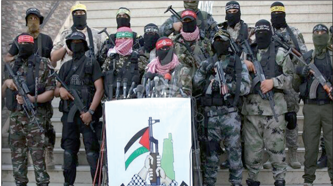
مقاومت فلسطین جایگزینی برای سازمان آزادی بخش فلسطین(ساف) نخواهد بود.