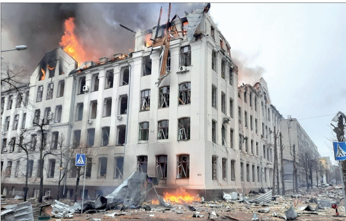
ویرانی مناطق مسکونی اوکراین توسط ارتش متجاوز روسیه

زلزلسکی: روسیه می‌خواهد اوکراین را محو کند