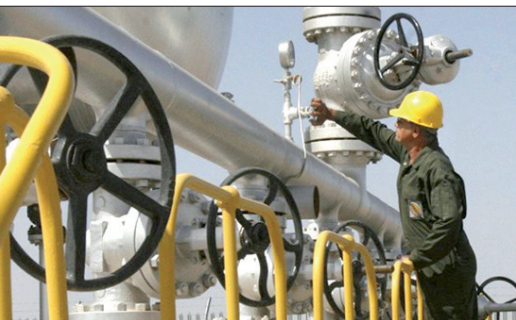
مدیرعامل شرکت ملی گاز:

و به دنبال اطلاعیه‌های قبلی این وزارت خانه و سفارت ایران در کیف اعلام کرد: همان‌گونه که پیش از این نیز با توجه به روند تحولات نظامی در اوکراین، از تمامی ایرانیان مقیم و دانشجویان درخواست شده بود از اوکراین خارج شوند، با این وجود هنوز شمار کمی از