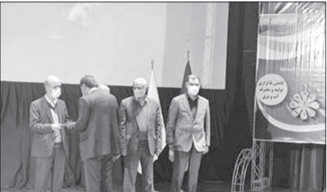
مراسم افتتاحیه مرکز تخصصی خدمات روانشناختی آستان قدس رضوی

سعی کرده منابع بودجه درآسودی را به تلاش و فعالیت مسئولان مرتبط مربوط کند. وی با بیان اینکه از دیگر ویژگی‌های لایحه بودجه ۱۴۰۱ است که سوسی کرده منابع بودجه درآسودی را به تلاش و فعالیت مسئولان مرتبط مربوط کند. وی با بیان اینکه از دیگر ویژگی‌های لایحه بودجه عدالت