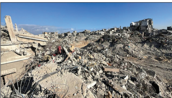
ساختمان‌هاست. به دلیل احتمال وجود بقایای موشک‌ها و مهمات منفجرشده، تمامی آوارها باید پیش از براساس این گزارش، عملیات پاکسازی آوار با چالش‌های فنی گسترده‌ای همراه خواهد بود و فراتر از یک پروژه معمول تخریب

روزنامه صهیونیستی «معاریو» گزارش داد که حجم آوارهای انباشته‌شده در نوار غزه در پی نزدیک به سه سال جنگ، به حدود ۴۰ میلیون تن رسیده و انتظار می‌رود به‌زودی مناقصه‌ای بین‌المللی برای آغاز بزرگ‌ترین عملیات جمع‌آوری و بازیافت آوار در منطقه برگزار شود؛ پروژه‌ای که هزینه آن حدود ۲٫۵ میلیارد دلار برآورد شده است.