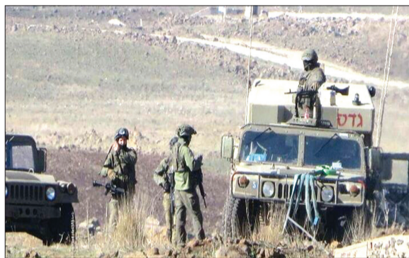
منابع خبری گزارش دادند که یک نیروی گشتی رژیم صهیونیستی وارد مناطقی از استان درعا سوریه شده است.

از زمان سقوط دولت بشار اسد در سوریه در آذر ۱۴۰۳، رژیم صهیونیستی با سوء استفاده از خلأ امنیتی موجود در این کشور، ضمن بمباران کلیه تأسیسات دفاعی سنکین و هواپیماهای جنگی این کشور، در منطقه القنيطرة در جنوب این کشور پیشروی کرده است. همچنین اسرائیل بخش‌هایی در جنوب این کشور از جمله ارتفاعات استراتژیک «جبل الشیخ» را به اشغال خود درآورده است. پس از استان جنوبی قنيطرة، استان درعا نیز با ۳۲ مورد نقض حریم در رتبه دوم قرار گرفته است، با این تفاوت که تجاوزات در این استان، ماهیتی خطرناک‌تر دارد و شامل حملات توپخانه‌ای، نفوذ زمینی و پروازهای فشرده جنگنده‌ها بوده است. همچنین نقض حاکمیت در مناطق ریف دمشق و السویده عمدتاً متمرکز بر پرواز هواگردهای متجاوز بوده است.