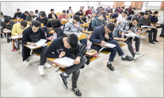
رئیس سازمان سنجش آموزش کشور

سهمیه‌های جنگ تحمیلی سوم در دست بررسی است. وزیر علوم نیز موضوع را عنوان کرده است اکنون کنکور داری سهمیه مناطق ۱ و ۲ و ۳ و سهمیه