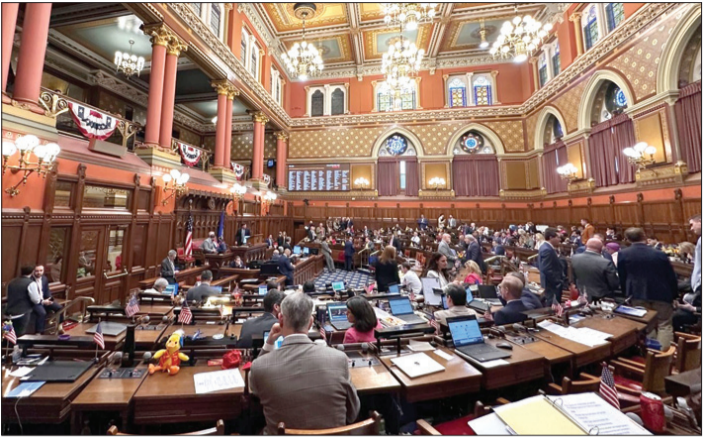
نمایندگان مجلس سنا در واشنگتن در جریان تصویب طرح محدودسازی اختیارات ترامپ علیه ایران در ۲۰۱۸

رؤسای جمهوری چین و روسیه در پایان مذاکرات خود در پکن در بیانیه مشترکی تأکید کردند: حملات نظامی آمریکا و اسرائیل به ایران نقض قوانین بین‌المللی و هنجارهای اساسی روابط بین‌الملل است.