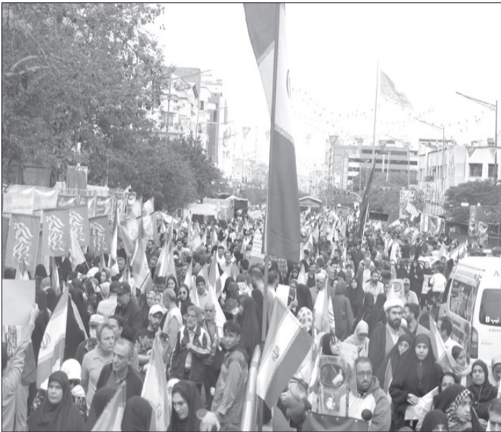
همبستگی ملی در شرایط جنگی بود. شرکتکنندگان با در دست داشتن پرچم کشورمان و هم‌چنین تصاویری از رهبر شهید انقلاب، با آرمان‌های امام راحل، امام شهید و رهبر انقلاب تجدید میثاق کردند.

مردم حاضر در خیابان که ۶۰ شبانه‌روز است که عرصه خیابان را رها نکرده‌اند، با سر دادن شعارهایی در حمایت از نظام اسلامی بر لزوم حفظ وحدت حول محور ولایت‌فقیه تأکید کردند. اما آنچه این اجتماع را با دوره‌های پیشین متمایز میکرد، تلفیق حال وهوای معنوی با روحیه جهادی و شهادت طلبی بود. بسیاری از خانواده‌ها با کودکان خردسال خود آمدہ بودند؛ کودکانی که پیشانی بندهای مزین به نام رهبر شهید انقلاب، حاج قاسم سلیمانی و شهدای مقاومت را بر سر یا بازو بسته بودند. همچنین حضور اقوام مختلف کشور را نیز در این تجمع شاهد بودیم و مسیر پر بود از یاد و خاطره شهدای مدرسه میناب که فضا را متفاوت کرده بود.