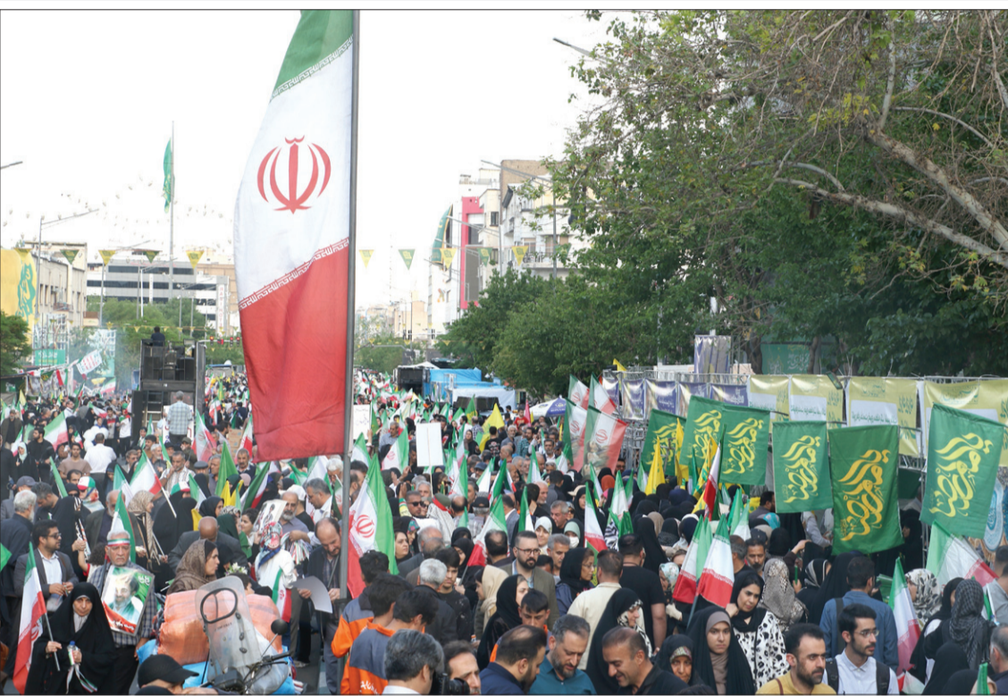
برگزاری اجتماع سراسری امام رضایی‌ها، همزمان با سالروز ولادت ثامن الحجج(ع)