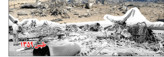
شکست شیطان بزرگ از طیس تا جنوب اصفهان به بهانه سالروز شکست حمله نظامی آمریکا در صحرای طیس

شکست‌های بی در پی استیکار جهانی در مقابله با انقلاب اسلامی ایران، به فرهنگی ماندگار در تاریخ کشورمان تبدیل شده است. یکی از این شکست‌ها، شکست پنجم اردیبهشت ۱۳۵۹ و تحقیر دولت و ارتش آمریکا در صحرای طیس است. در پنجم اردیبهشت سال ۱۳۵۹ دولت کارتز به بهانه نجات جاسوسان آمریکایی که در جریان اشغال لانه جاسوسی آمریکا در تهران بازداشت شده بودند، گروهی نظامی متشکل از نیروهای زبده ارتش آمریکا را توسط چندین فروند هواپما و هلیکوپتر پیشرفته به صحرای طیس منتقل کرد. اما این تهاجم ناجوانمردانه، با شکست مفتضحانه‌ای روبرو شد. حضرت امام خمینی شکست مفتضحانه و ذلت بار آمریکا در صحرای طیس را حاصل و نتیجه قطعی امدادهای الهی می‌دانست و همین عنایات حضرت حق بود که باعث شد طوفان‌های مهبلی شن به حرکت آیند و مانع دید خلبان‌ها و موجب برخورد شدید هواپیماهای جنگی و انفجار آنها شوند. حضرت امام خمینی، شن‌های صحرای طیس را مامور خدا دانستند و در عبارتی صریح اعلام کردند: «این مانور احقمانه به امر خدای قادر شکست خورد.» تأکید و تصریح امام خمینی مبنی بر نزول امدادهای غیبی الهی در صحرای طیس و به شکست و ذلت کشاندن آمریکا در تهاجم به اسلام و انقلاب و نظام و سرزمین اسلامی نوعی توجه دادن به نصرت خداوند قادر متعال در از بین بردن جبهه‌های ستمگران و نزول یاری و مساعدت خود به اهل ایمان بود. این سنت ثابت و تغییرناپذیر و همیشگی الهی است که در همه اعصار و زمان‌ها جاری است و در صورتی که ملت‌های مسلمان به وحدت بگرایند و در راه خدا پایداری ورزند نصرت الهی به صورت امدادهای غیبی بر آنان نازل خواهد شد.