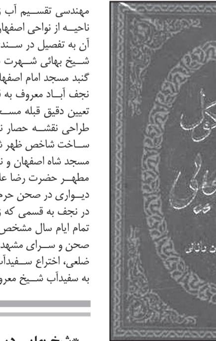
ترجمه: پدید و انان

شیخ بهایی در تمام علوم رسمی زمان خود دست داشت و در شماری از آنها متخصص به فرد بود. او در حوزه معارف دینی و علوم اسلامی استاد بود. در سلسله اجازات روایی، از محدثان امامی برجسته قرن یازدهم به شمار می‌رود و طرق بسیاری از اجازات محدثین در قرون اخیر به او و از او به پدرش و شهید ثانی منتهی می‌شود. وی از ۲۵ سالگی در تفسیر قرآن به تدقیق پرداخته و آن را اشرف علوم دانسته است. مهمترین کوشش بهائی، ارائه توجیه و تبلیلی در مورد وضع معانی جدید برای تقسیم‌بندی احادیث ازسوی متأخران است. به گفته وی، وقوع فاصله زمانی بین متأخرین و سلف صالح و احتمال از میان رفتن کتب اصول