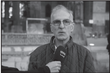
اصفهان–خبرنگار روزنامه جمهوری اسلامی: رئیس شبکه

دانشگاهی یونسکو در ایران در بازدیدی از اماکن و آثار تاریخی اصفهان گفت: به وجود آمدن چنین خسارات گسترده‌ای در بی تهاجم دشمن آمریکایی‌صهیونیستی قابل پذیرش نیست و امید است هر چه سریع‌تر بناهای آسیب‌دیده و تخریب‌شده را بازسازی و مرمت کنیم.