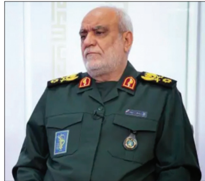
رئیس سازمان اطلاعات سپاه به شهادت رسید ۲