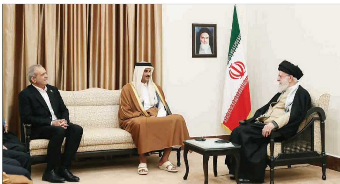
رهبر انقلاب در دیدار امیر قطر و هیئت همراه:

مسئول سیاست خارجی اتحادیه اروپا در شبکه اجتماعی «ایکس» آمریکا را از افتادن در «دام» روسیه برحذر داشت! به گزارش خبرگزاری فرانس ۲۴، کاجا کالاس، مسئول سیاست خارجی اتحادیه اروپا در پیامی از آمریکا خواست تا در دام روسیه نیفتد! کالاس