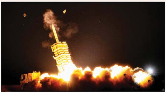
رزمایش اقتدار پدافند هوایی ۱۴۰۳ ارتش آغاز شد

در این مرحله، بندهای مختلف لوایح مذکور مورد بحث و بررسی های فنی، تخصصی و کارشناسی قرار می گیرند