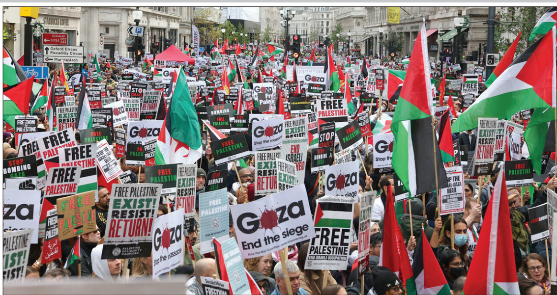
شهرهای مهم اروپا بار دیگر صحنه تظاهرات حامیان فلسطین شدند

ساماندهی اتباع بیگانه، اولویتی است که دولت چهاردهم باید آن را به صورت جدی مورد پیگیری قرار دهد و مجلس هم طرح الحاق ۵ تبصره به ماده ۱۶ قانون راجع به ورود و اقامت اتباع خارجه در ایران را در جلسه علنی ۲۱ مردادماه اعلام وصول و به کمیسیون مربوطه برای بررسی ارجاع کرده است