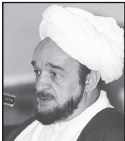
از مرحوم علامه محمدتقی جعفری نقل شده که گفت:

یکی از نوه‌های مرحوم مورخ‌الدوله سپهر نویسنده کتاب ناسخ‌التواریخ به منزل ما آمد و اظهار داشت در شب عید غدیر در منزلی در شمال تهران، جشنی برقرار است و علاقه‌مند شما هم در آن شرکت کنید. گفت: در این جشن تعداد زیادی از رجال لشکری و کشوری هستند. من تصور می‌کنم که اگر شما تشریف بیاورید و در آن محفل، مطالبی نیز بفرمایید مؤثر واقع شود.