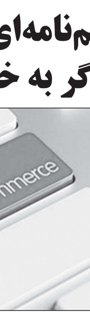
کشور چین در حال حاضر به ۳۴ درصد از بازار جهانی رسید

کشوری در دنیا بود که رشد مثبت ۴ درصدی داشته است اما آمریکا منفی ۱۲ داشته است.