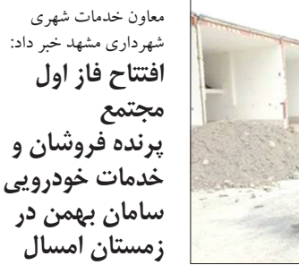
معاون خدمات شهری شهرداری مشهد خبر داد:

رئیس شبکه دامپزشکی شهرستان مشهد گفت: ۱۰ تن از این تخم مرغ‌ها فاقد نشانه‌گذاری بوده‌اند و با توجه به حجم زیاد به‌زودی و بعد از کنترل مدارک بهداشتی، بازدید ظاهری، کنترل نشانه‌گذاری و نمونه‌برداری تعیین تکلیف خواهند شد.