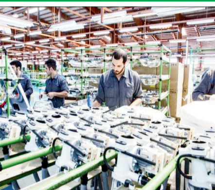
کارخانه تولیدی لوازم خانگی در استان تهران.

کرد، تعلیق محدودیت‌های مندرج در مواد ۵ و ۲۱ قانون اصلاح قانون صدور چک» در سال جهش تولید محور دیگر این جلسه بود، به خصوص اینکه پیش از این، واحدهایی با حداقل ۱۰۰ کارگر که به دلیل چک برگشتی دچار محدودیت‌های این دو ماده قانونی مثل دریافت دسته چک و صدور چک جدید در سامانه صیاد و استفاده از چک موردی و همچنین افتتاح حساب یا دریافت تسهیلات بانکی شده بودند، از این محدودیت‌ها مستثنی می‌شدند. اما اکنون در جلسه ستاد تسهیل و رفع موانع تولید، مقرر شد تولیدکنندگان دارای ۵۰ شاغل به بالا نیز از این شروط مستثنی شوند که پیشنهاد مربوطه به هیات وزیران منعکس خواهد شد تا با بهره مندی واحدهای تولیدی دارای چک برگشتی از خدمات بانکی، از تعطیلی این واحدها جلوگیری شود.